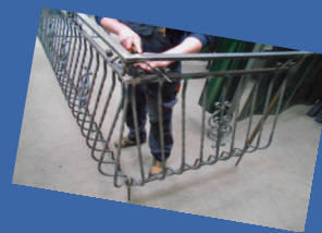
Zajęcia praktyczne realizowane np. w pracowni spawania i obróbki metali

Po ukończeniu szkoły będziesz mógł pracować w: